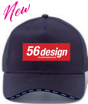
Navy / Red