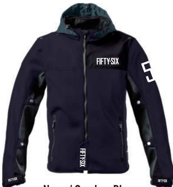
Navy / Smokey Blue