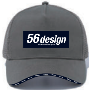
Gray / Navy