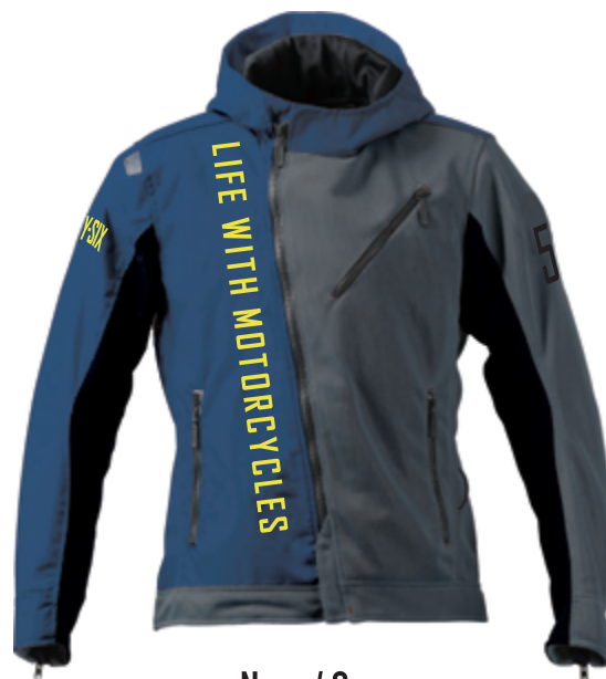
Navy / Gray