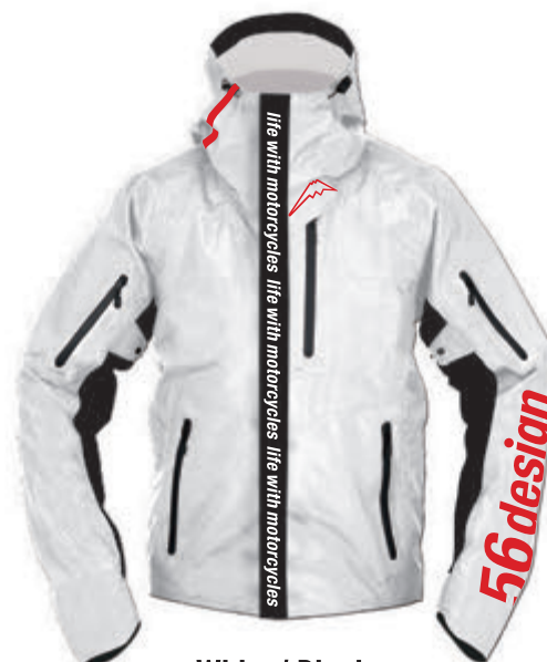
White / Black