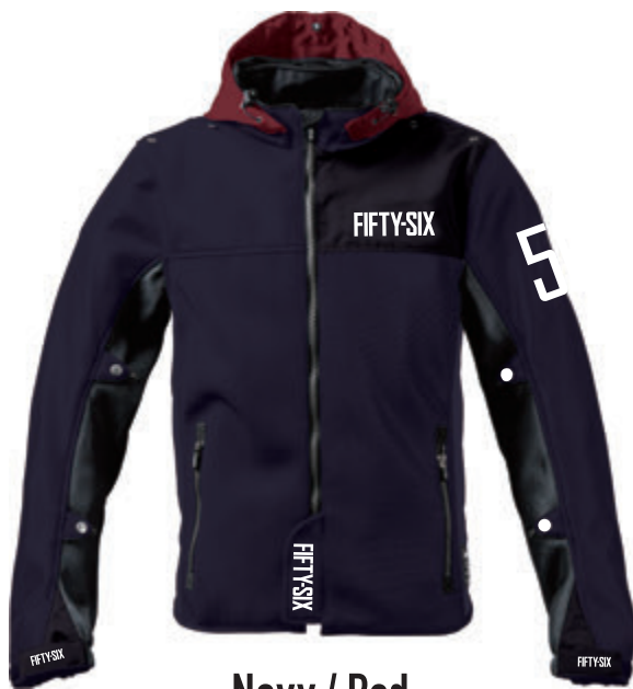
Navy / Red