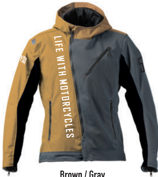
Brown / Gray