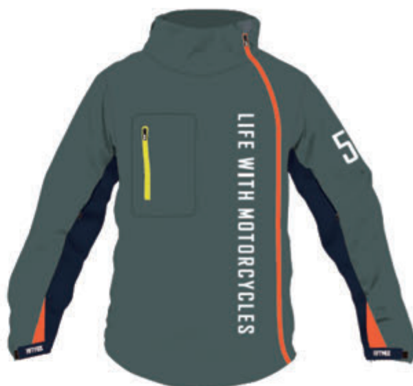
Smokey Green / Navy