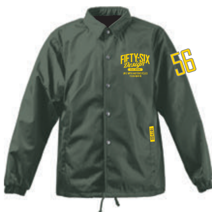
RIDING COACH JACKET 2