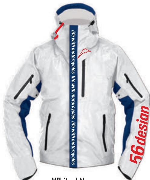
White / Navy