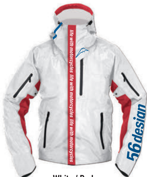
White / Red