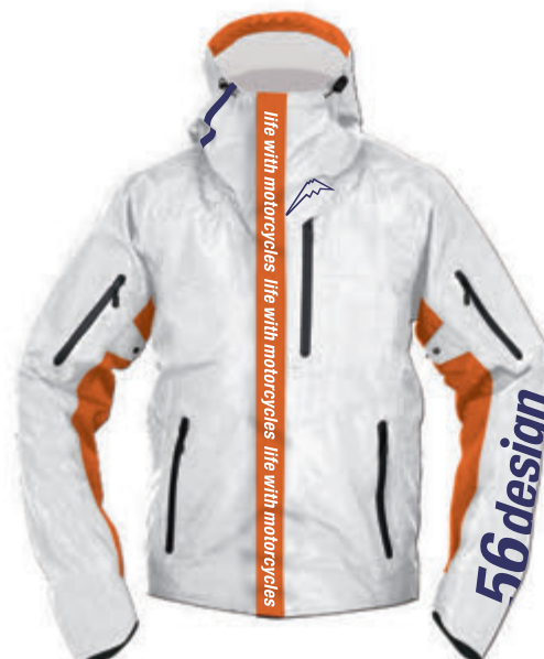
White / Orange