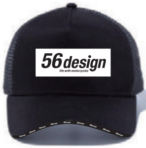
Black / White