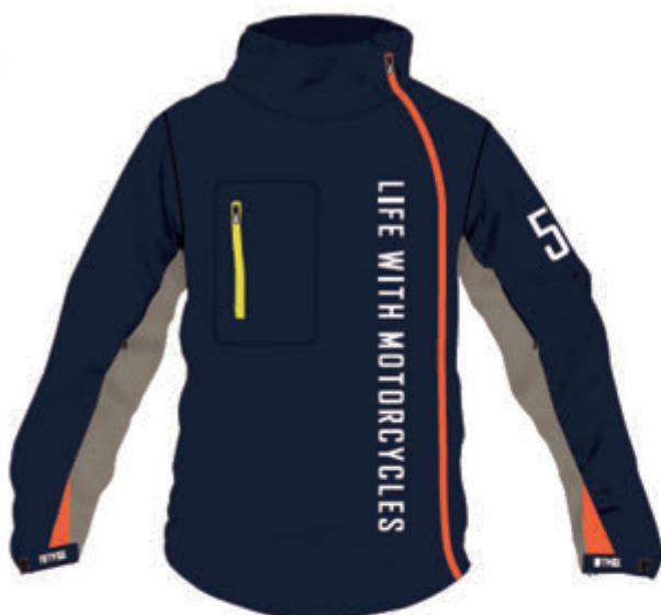
Navy / Beige