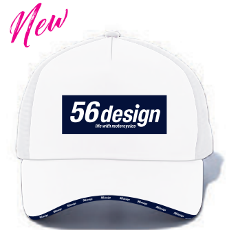
White / Navy