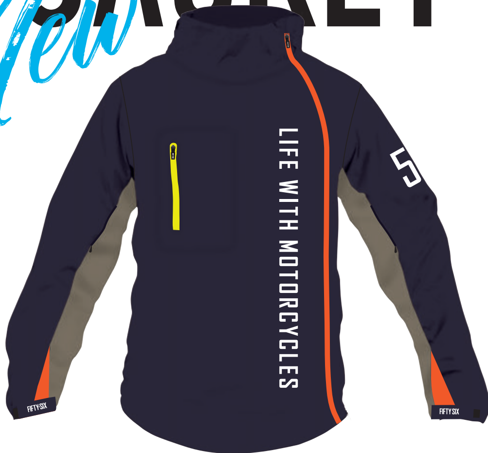
アークジップジャケット

SIZE WM/S/M/L/XL ¥42,700 (税込 ¥46,970) 予価