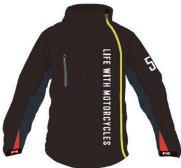
Black / Dark Gray