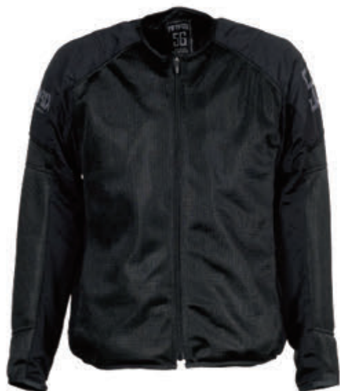
Inner Protection Jacket