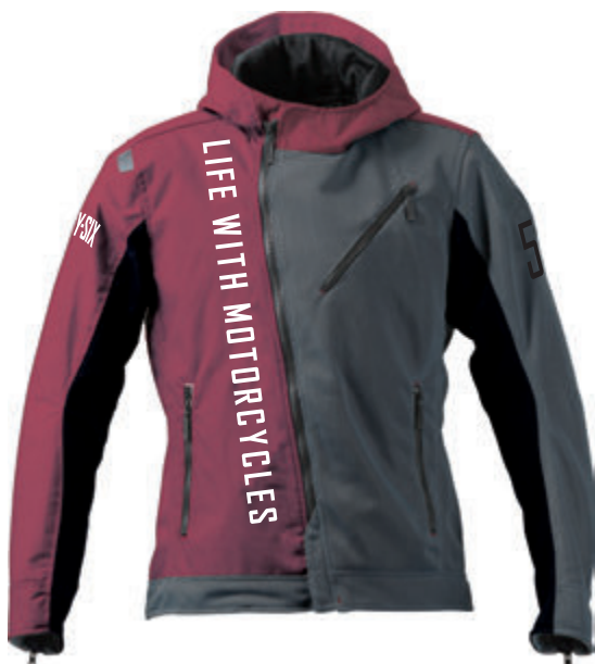
Cherry Red / Gray