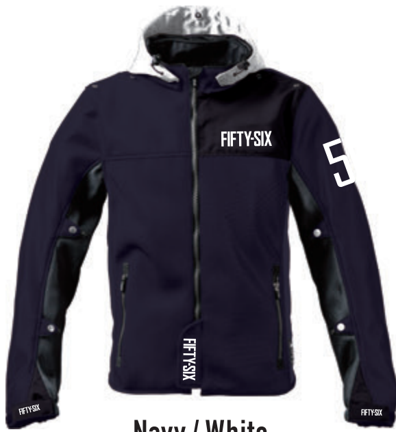
Navy / White