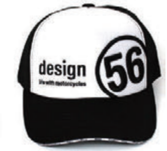
Black / White