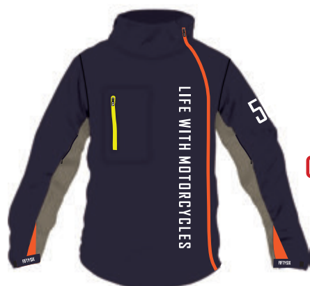
ARC ZIP JACKET

このスタイルの特徴はアウターとインナーがワンセットで、従来のライディングウェアの様にアウター側にパッドを装着するものではなく、独立したメッシュベースのインナージャケットの肩・肘・背中にソフトパッドを装備、オプションで胸部パッドの装着も可能です。