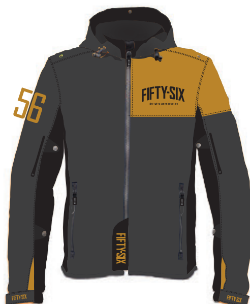
Yellow Ocher イエローオーカー