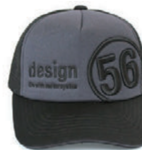
Black / Grey