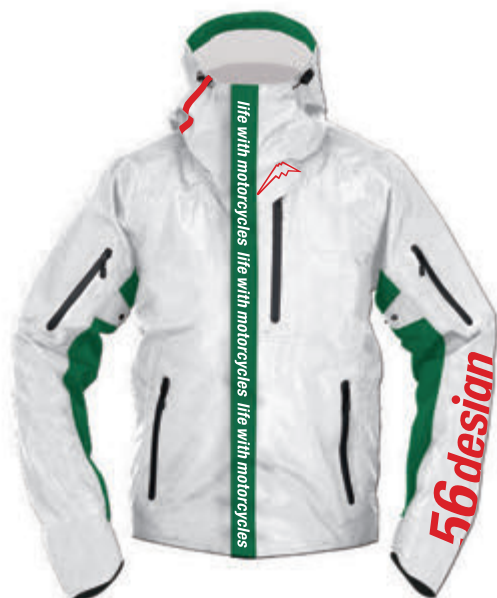
White / Green